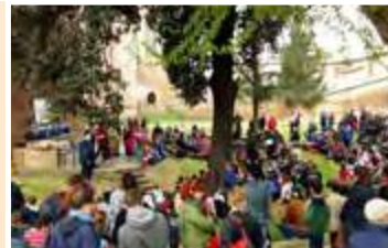
Premiazione G.P. PROMESSE

Partenza: Piazza Farini ore 9.05 Iscrizione 2 € SABATO 13 APRILE dalle 15 alle 18. DOMENICA 14 APRILE dalle 7 alle 8.45