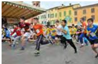
Partenza G.P. PROMESSE

TROFEO FONDAZIONE CASSA DI RISPARMIO DI RAVENNA