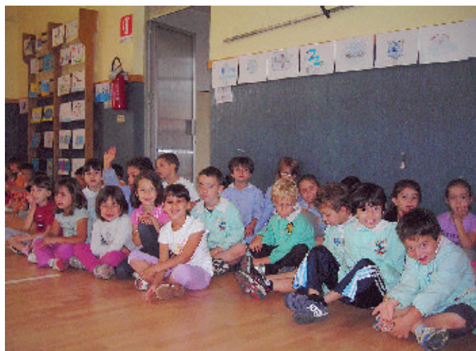
Alcuni bambini che hanno partecipato al concorso «Io nuoto a Montà»

Sul nuoto libero, infine, alla piscina di Montà ci sarà o un biglietto singolo o una tessera a 10 ingressi oppure ancora l'abbonamento annuale (quest'ultimo con incluso il centro benessere). [R.A.]