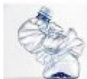
BOTTIGLIA PLASTICA OLTRE 500 ANNI