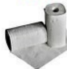
CARTA ASSORBENTE OLTRE 4 SETTIMANE

La realizzazione grafica è stata curata dai componenti del consiglio direttivo Lega Montagna