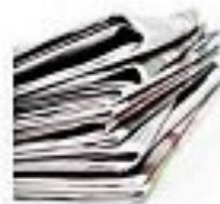
CARTA 2 MESI