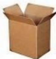
CARTONE 2 MESI