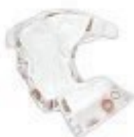
PANNOLINO OLTRE 1 ANNO