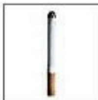
SIGARETTA OLTRE 1 ANNO