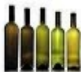
BOTTIGLIE VETRO ALCUNI MILLENNI