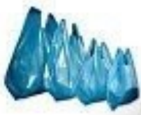
SHOPPER OLTRE 800 ANNI