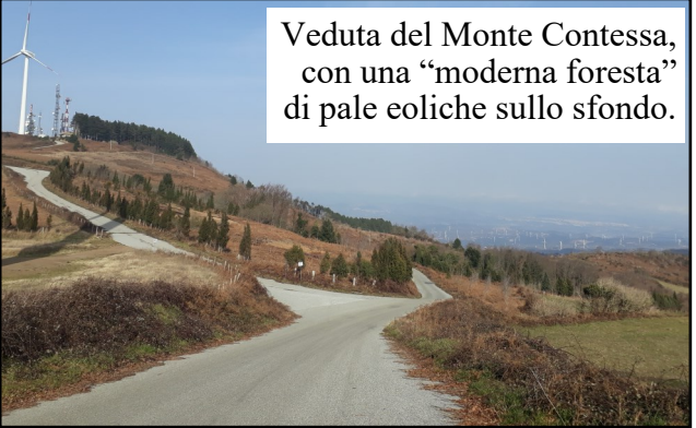
Veduta del Monte Contessa, con una "moderna foresta" di pale eoliche sullo sfondo.

Sopra: piazza Italia a Cortale, con l'unica scultura documentata di Andrea Cefaly, che raffigura l'Italia come una donna che stringe in mano una corona fiorita; da qui il nome dialettale con cui è nota l'opera: "donnahjuri".