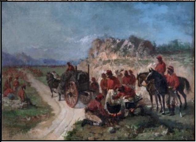
"Il bivacco di Garibaldi", celebre opera del pittore patriota Andrea Cefaly da Cortale (XIX sec., olio su tela, Museo Marca di Catanzaro)

Sopra: piazza Italia a Cortale, con l'unica scultura documentata di Andrea Cefaly, che raffigura l'Italia come una donna che stringe in mano una corona fiorita; da qui il nome dialettale con cui è nota l'opera: "donnahjuri".