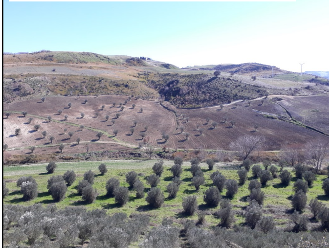
Panorama sulle colline, viste da San Fantino