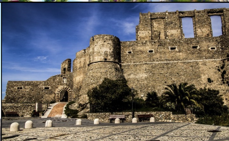
Il castello normanno di Squillace, opera dell'XI secolo.

In basso: foto aerea della grande basilica normanna di Santa Maria della Roccelletta (XI secolo) nel parco archeologico greco-romano di Skilletion - Scolacium a Roccelletta di Borgia.