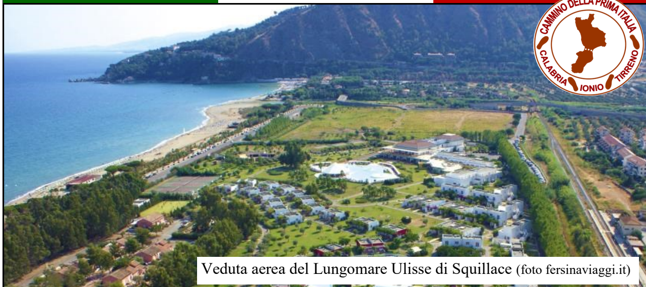
Veduta aerea del Lungomare Ulisse di Squillace