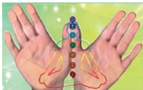
MASSAGGI LE ALI DELL'ARMONIA di ANNA BUZZI