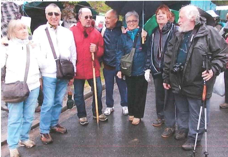
Les randonneurs ont affronté la pluie.

La Nouvelle République - 29/04/2014 05:27