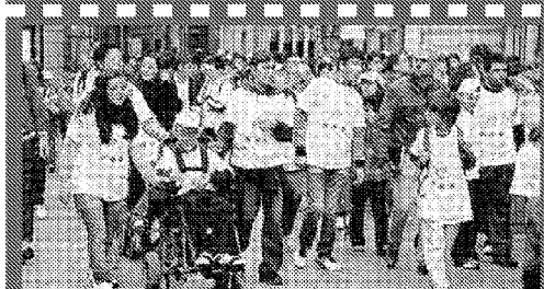
Volontari e accompagnatori presenti in gran numero