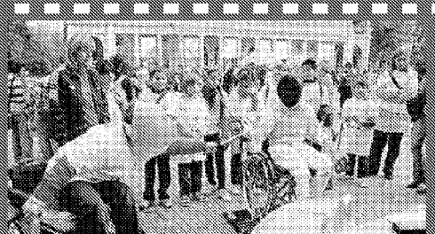
Un aiuto di sostegno