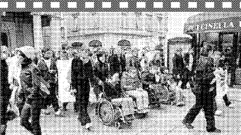
La fila per raggiungere la piazza