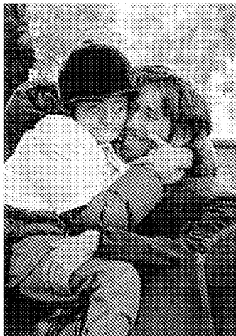
Un genitore abbraccia il figlio sul cavallo