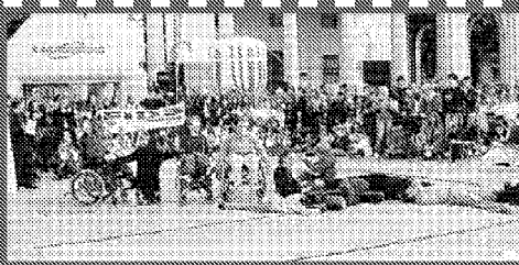
Il pubblico numeroso assiste alle gare