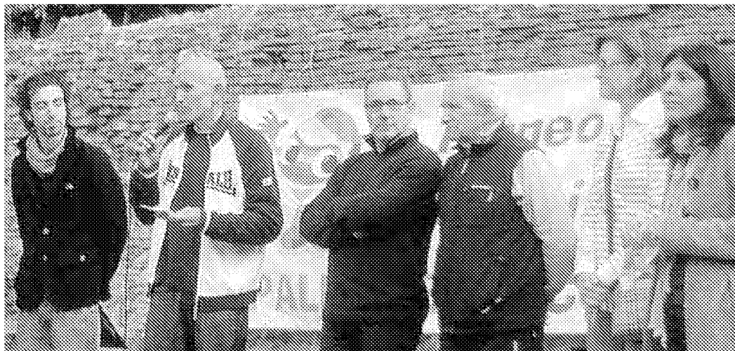
Due immagini del Pallone Etico 2010: sopra la cerimonia d'apertura al Parco Cervi, sotto un momento delle gare di pallavolo in Piazza della Vittoria

La nuova versione dovrebbe essere riproposta nei prossimi anni, anche se già si pensa a qualche miglioria e modifica. Ad esempio la data potrebbe es-