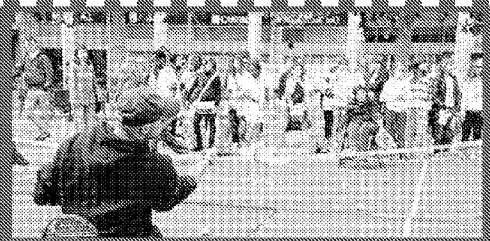
Ecco come si gioca a tennis