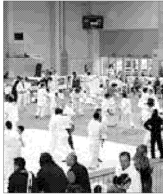
Quasi 700 judoka a Lugo

LUGO - Si svolto lo scorso fine settimana al Pala Banca di Romagna di Lugo, il 23° Trofeo Internazionale "Romagna Judo 2010", prestigiosa manifestazione sportiva che ha raccolto la partecipazione di quasi 700 atleti e oltre 150 società sportive; con rappresentanze provenienti dalla Svizzera, Ucraina e Romania.