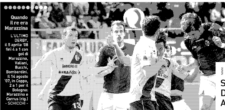
Quando il re era Marazzina

IN OCCASIONE di Bologna-Modena, questa sera la Curva San Luca rimarrà chiusa. Lo ha deciso il club rossoblù, dopo la decisione del Comitato di analisi per la sicurezza delle manifestazioni sportive (Casms). Quest'ultimo su indicazione dell'Osservatorio del Viminale, ha vietato la vendita dei biglietti ai residenti nella provincia di Modena sprovvisti della tessera del tifoso. I supporter ospiti che ne sono in possesso, potranno acquistare il biglietto per la tribuna, i distinti o la curva Bulgarelli.