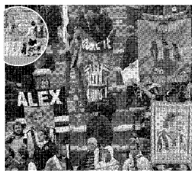
Chioschi con i colori di San Luca. In alto: i tifosi bolognesi in curva. A destra: un tifoso con la maglia della Juve

C he la tessera del tifoso abbia creato più guai che benefici è ormai un'affermazione che l'opinione pubblica ha consolidato. Ora, per evitare che si ripetano fattacci (non inediti in Italia quest'anno) come quello di domenica nella curva San Luca, non resta che appellarsi alle società e alle Questure. A Bologna si cerchi in ogni modo di evitare distrazioni nei controlli e contatti fra i tifosi: è paradossale, ma se non si può impedire agli ultras rivali di entrare in San Luca, almeno si tuteli il tifoso «normale». Nelle partite a rischio, si raddoppi l'attenzione per dimezzare il danno. (d.l.)