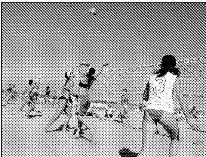
Young Volley richiama circa 6mila partecipanti

L'anno scorso solo il Young beach volley ha portato sulla spiaggia di Igea Marina cento società sportive da tutta Italia, impegnando 65 alberghi e 12 stabilimenti balneari.