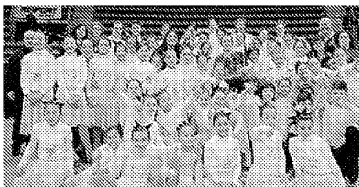
PICCOLI FENOMENI Le bimbe vincitrici del trofeo Mariele Ventre