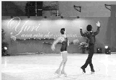
L'esibizione dello scorso anno