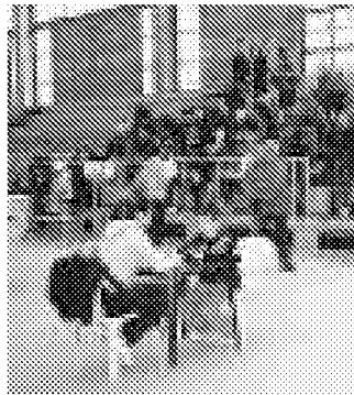
Lo scambio delle figurine

Un appuntamento che si rinnova dopo il grande successo dell'anno scorso, quando il centro castelnove-