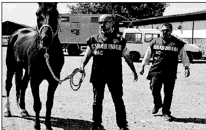
Sopra e in alto a sinistra, alcuni momenti dell'operazione cond

Dodici persone denunciate e il sequestro di sette splendidi cavalli sono i frutti di una vasta operazione che ha sgominato gli organizzatori di un sistema spregiudicato. Il Nucleo antifrodi dei carabinieri di Salerno, in collaborazione con i militari dell'Arma di Caserta, Napoli e dello stesso Comando di Salerno, hanno messo in campo una cinquantina di uomini, che hanno effettuato un primo intervento il 23 gennaio. Quel giorno è stata scoperta una corsa clandestina di cavalli nel centro abitato di Casapulla, nel territorio casertano. Le successive indagini, coordinate dalla Procura di Santa Maria Capua Vetere, hanno fatto cadere nella rete dodici colpevoli, alcuni