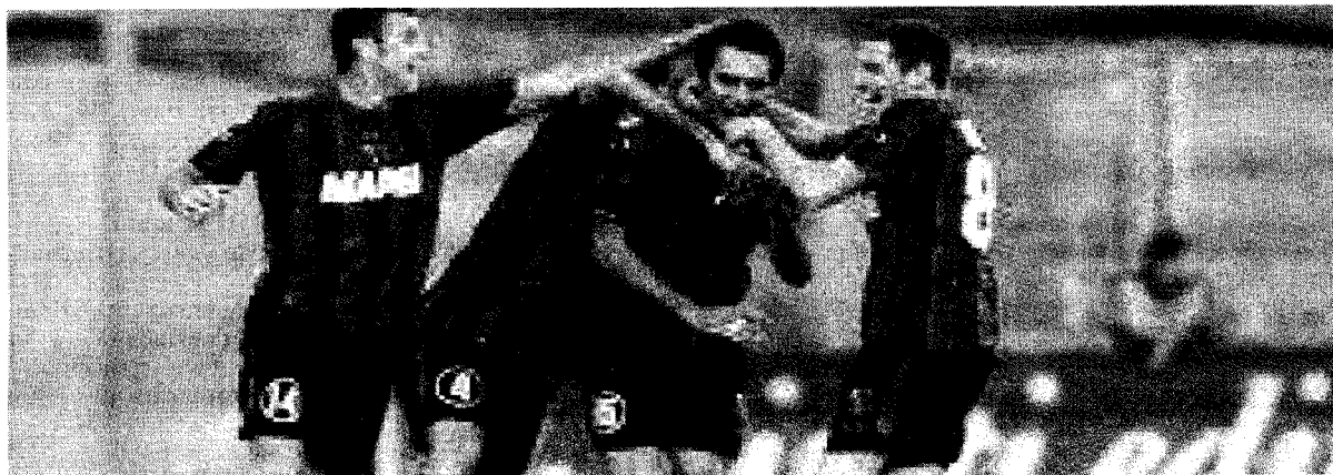
La squadra del Sassuolo in azione.

Dei neroverdi parlano alcune intercettazioni che chiamano in causa la partita col Siena. Per i canarini si parla di una partita con l'Albino Leffe