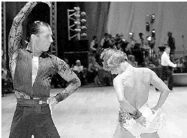
SUCCESSO MONDIALE Presenti ballerini provenienti da oltre 33 nazioni, tra cui anche l'Australia

Rimini Fiera è stata per nove giorni un vero e proprio laboratorio nel quale si sono confrontati atleti di tutte le età. In gara, infatti, c'è stato anche un ballerino di quasi 90 anni. Nonostante la delicata fase del commissariamento per la Fids, anche quest'anno il numero di partecipanti alle gare, che si sono sviluppate in decine di discipline, sono stati fortissimi. Come il profilo internazionale: a Rimini sono infatti arrivati ballerini provenienti da ben 33 nazioni diverse, come l'Australia. La più grande manifestazione mai realizzata in Europa. Fids assicura: «Rimini ha risposto in maniera eccellente alla manifestazione. L'idea è quella di tornare in questa sede per replicare con il maxi evento».