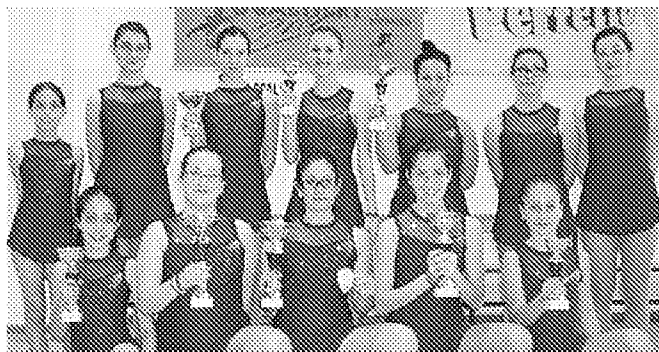
Il team di pattinaggio artistico della società Gualtieri 2000