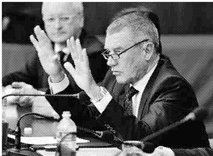
Due immagini della conferenza; qui sopra il ministro Fazio

Il ministro Fazio ha sottolineato l'importanza del pro-