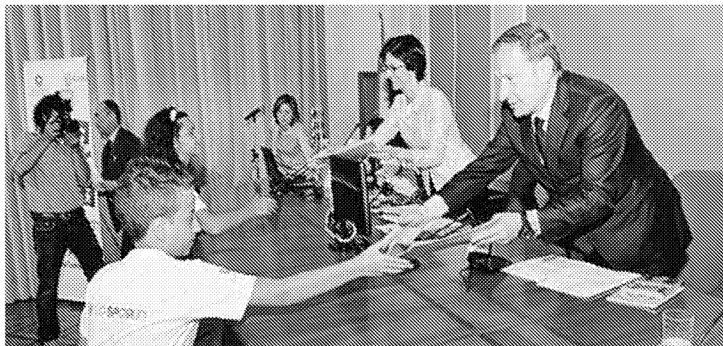
Il ministro Gelmini e il presidente Petrucci con alcuni giovani studenti