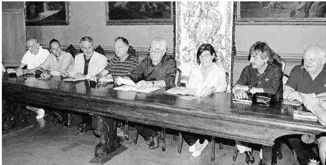
Il tavolo dei relatori alla presentazione del Gnaker