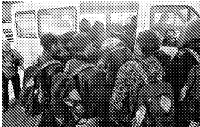
I profughi destinati all'accoglienza in città e provincia al loro arrivo