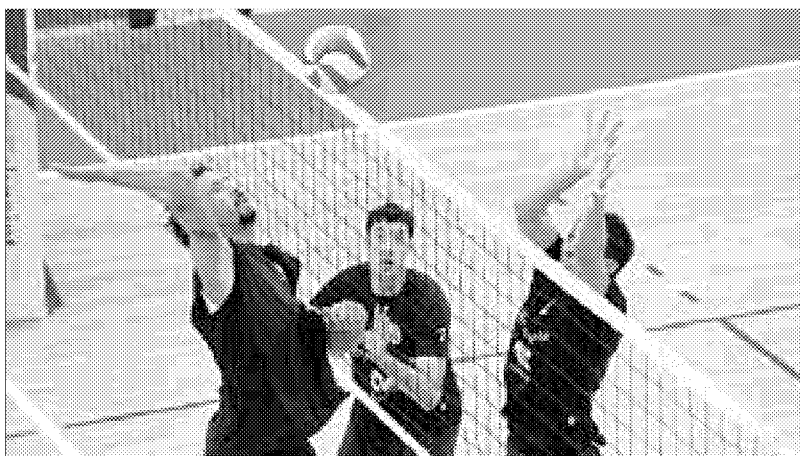
Robur: ha conquistato l'A1 quest'anno