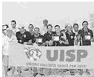
Il gruppo di vincitori della Pol. Valmar Novafeltria