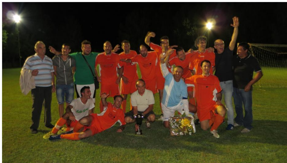
SOCIETA' RAVALLE DETENTRICE DELLA 18° EDIZIONE