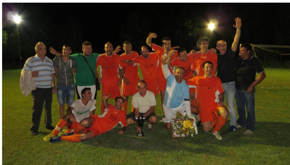
SOCIETA' RAVALLE DETENTRICE DELLA 18° EDIZIONE