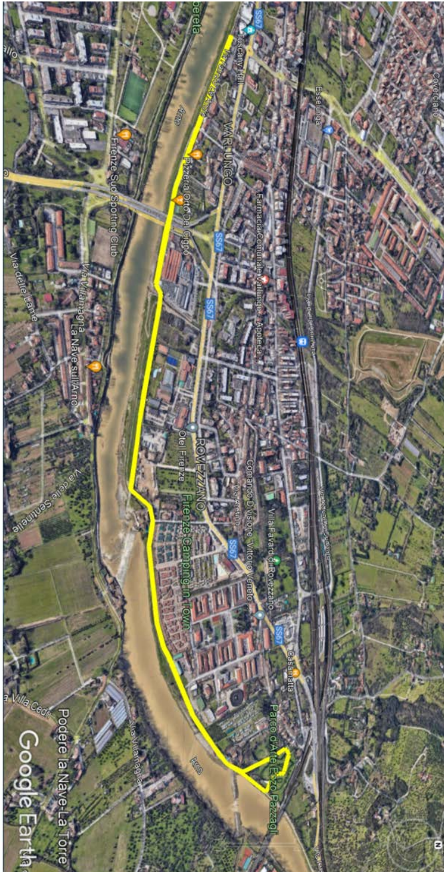
CAMMINATA LUNGO L'ARNO