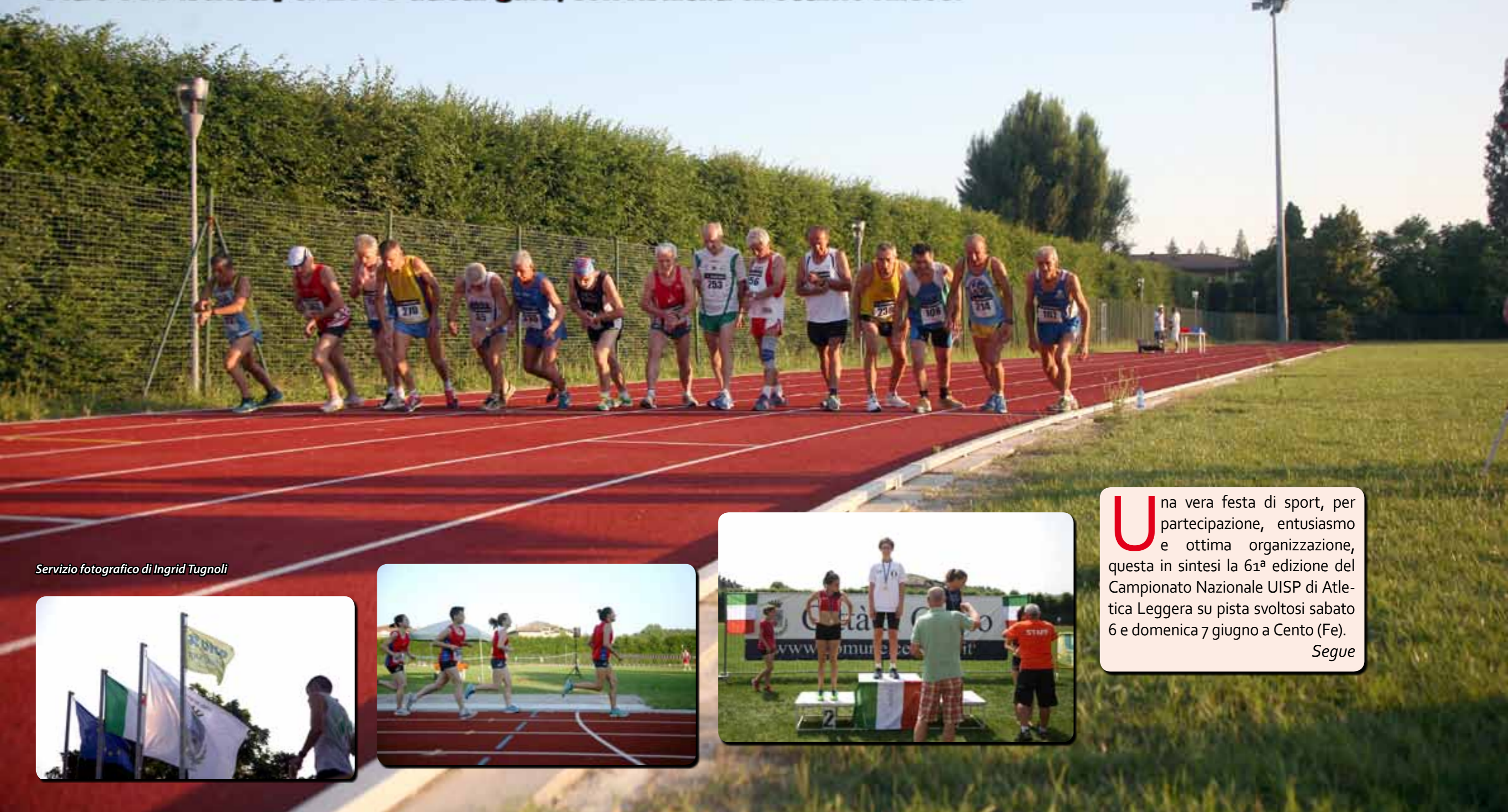
Servizio fotografico di Ingrid Tugnoli

Record di presenze per i Campionati nazionali UISP. Oltre 800 iscritti per 2000 atleti/gara, con risultati di ottimo rilievo.