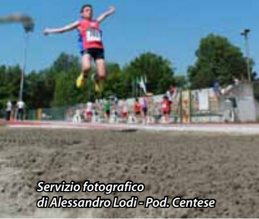
Servizio fotografico di Alessandro Lodi - Pod. Centese