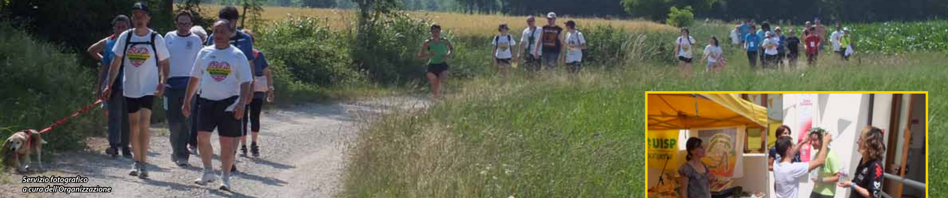
Servizio fotografico a cura dell'Organizzazione

D omenica 7 giugno, è arrivata la 28ª edizione della marcia campestre "Camminare per conoscersi" che si svolge nella zona di Baldasseria, Udine Sud, e che da 7 anni si accompagna alla competitiva "Giro delle Fontane - Memorial Alessia Di Bernardo".