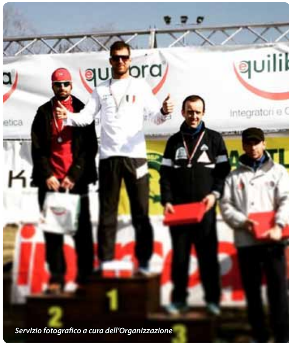
Servizio fotografico a cura dell'Organizzazione