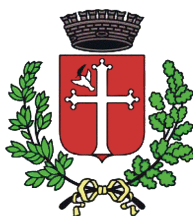
Comune di Lugo