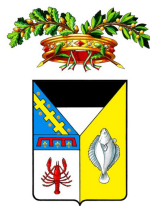
Provincia di Ferrara