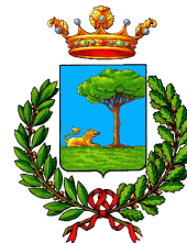
Comune di Alfonsine