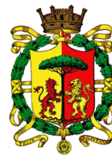
Comune di Ravenna