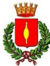
Comune di Fusignano