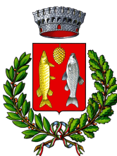
Comune di Conselice