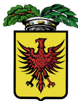
Provincia di Ravenna