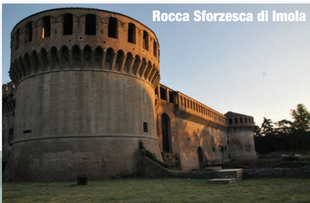
Rocca Sforzesca di Imola