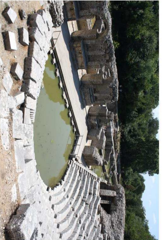
Parco Archeologico di Butrint: il Teatro