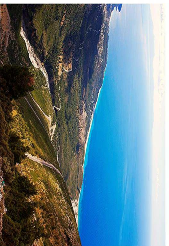
Llogara: vista panoramica dal Passo di Cesare

GITA OPZIONALE A SCELTA (pranzo incluso) € 30,00