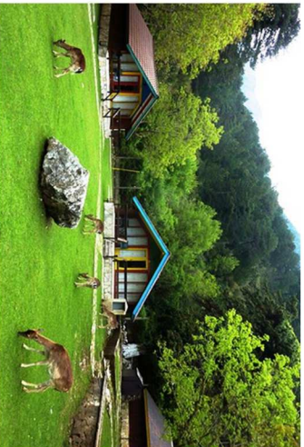
Cebiatiti nel Parco Nazionale di Llogara