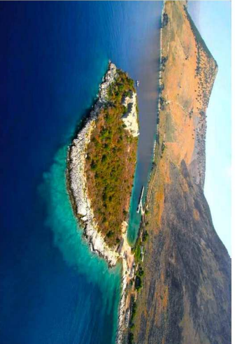
Porto Palermo: baia e Castello di Ali Pasha