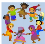
TEATRO COUNSELING BAMBINI