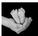
RIFLESSOLOGIA PLANTARE BAMBINI