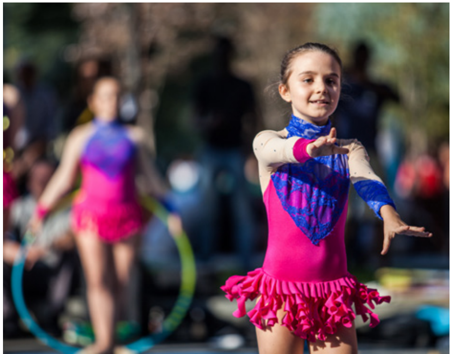
Il Memorial Giovanetti, una festa di sport per tutti al centro di Reggio Emilia con centinaia di giovani, che si è tenuta il 24 settembre 2016.