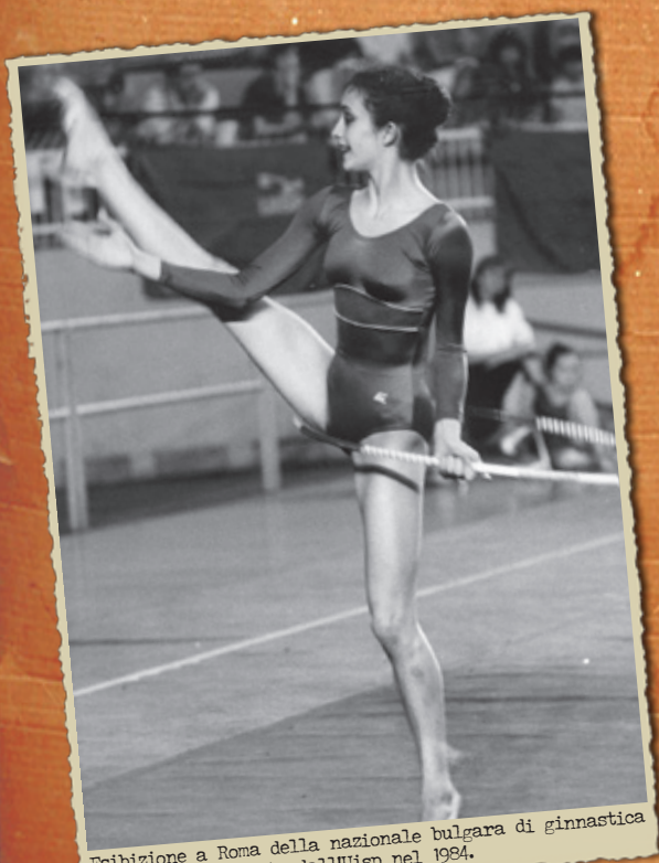
Esibizione a Roma della nazionale bulgara di ginnastica ritmica, organizzata dall'Uisp nel 1984.

"Il tempo libero è un diritto fondamentale. L'uomo che trae dal suo lavoro solo di che vivere non è un uomo libero, ma conduce un'esistenza puramente biologica"