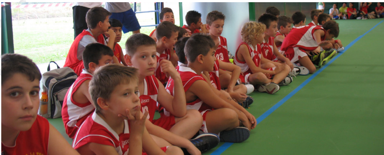
Trecento ragazzi coinvolti nella manifestazione di basket al Palamedolla, in provincia di Modena (1° maggio 2019)

U na giornata ricca di divertimento, sport sociale e ambiente, pilastri sui quali si fonda la lunga partnership che lega Ecopneus e Uisp che in questo caso riguarda la riqualificazione sostenibile dell'impiantistica sportiva Uisp con campi da gioco in gomma riciclata. Il Palamedolla venne ristrutturato dopo il terremoto del 2012 grazie all'intervento dell'Uisp e di Ecopneus e l'inaugurazione avvenne il 28 settembre 2013, alla presenza delle istituzioni locali e regionali.