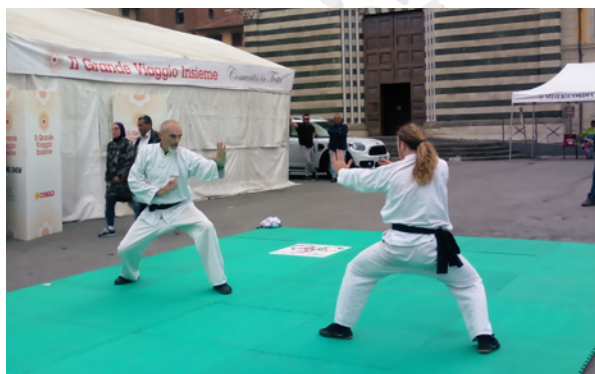
Prato, 17 - 19 ottobre