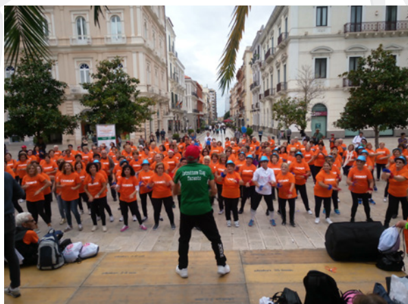
Taranto, 3 - 5 ottobre