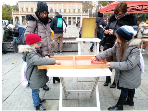
Grande Viaggio insieme a Reggio Emilia, 21 - 23 novembre