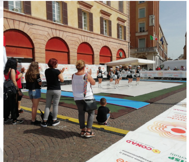
Forlì, Piazza Saffi, 13 - 15 giugno