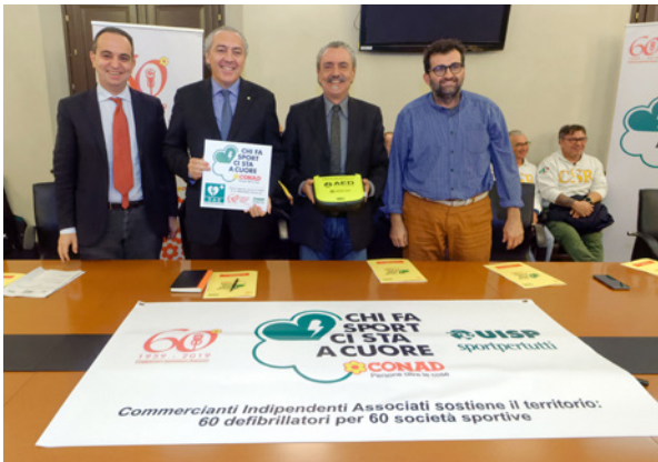
Consegna finale campagna CIA Conad a Ravenna, 28 novembre