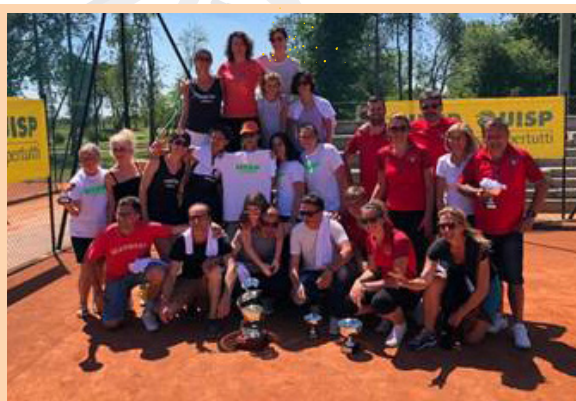
Phyto Garda è partner dei Campionati Assoluti di Tennis, 24 - 31 agosto a Pugno Chiuso, ospiti del Gruppo Marcegaglia.