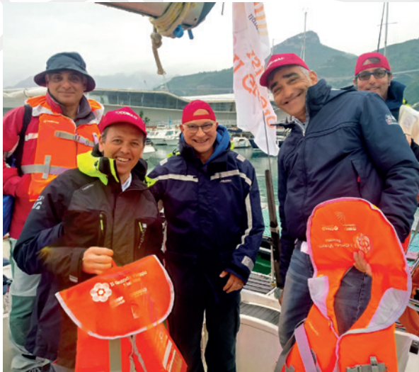
Salerno, lungomare, 2 - 4 maggio