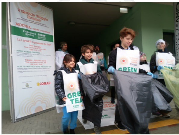
Grande Viaggio insieme a Modena, 14 - 16 novembre