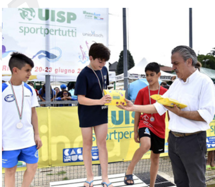
Riccione, finali nuoto, 20 - 23 giugno