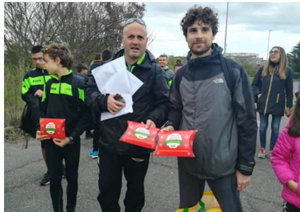
Corri per il verde a Roma con Phyto Garda, novembre - dicembre