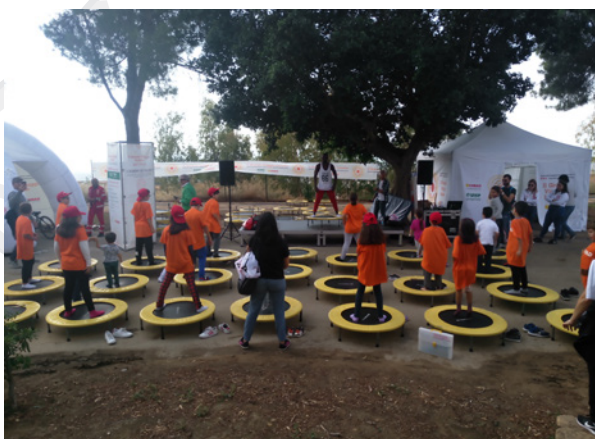
Agrigento, 24 - 26 ottobre