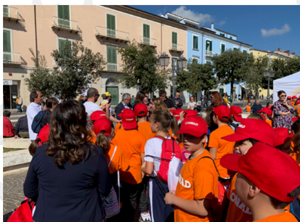
Campobasso, 10 - 12 ottobre