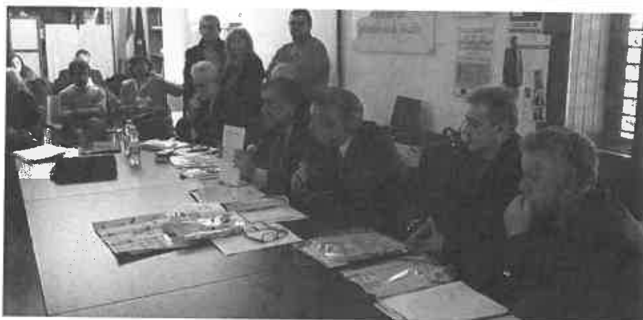
Presentata a Palermo la trentatreesima edizione dell'evento.