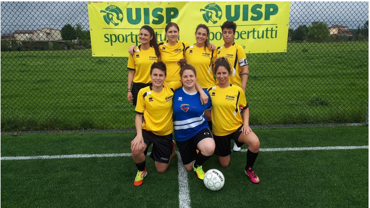
La Rappresentativa di Calcio a 5 Femminile di UISP Parma