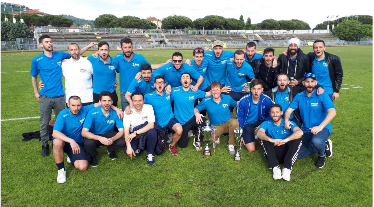
La Rappresentativa di Calcio a 11 Maschile di UISP Parma