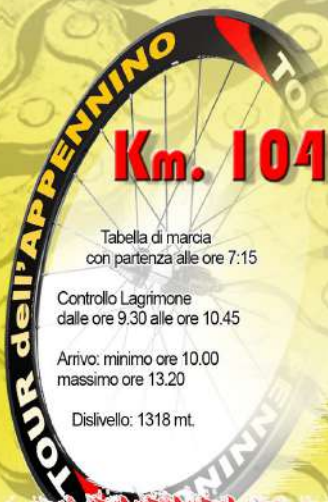
Tabella di marcia con partenza alle ore 7:15

Controllo Lagrimone dalle ore 9.30 alle ore 10.45