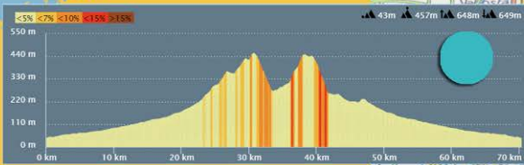
Altimetria Mediofondo Km. 70 disl. 648m.

distanti oggi per stare uniti domani Manifestazione a scopo benefico per raccolta Pedaliamo per aiutare chi lotta contro contagio