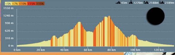
Altimetria Granfondo Km. 133 disl. 2188m.