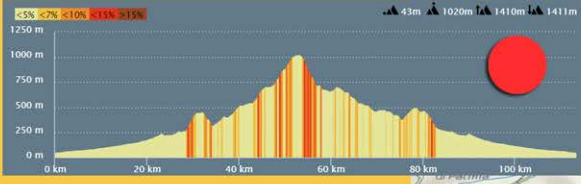
Altimetria Fondo Km. 113 disl. 1410m.