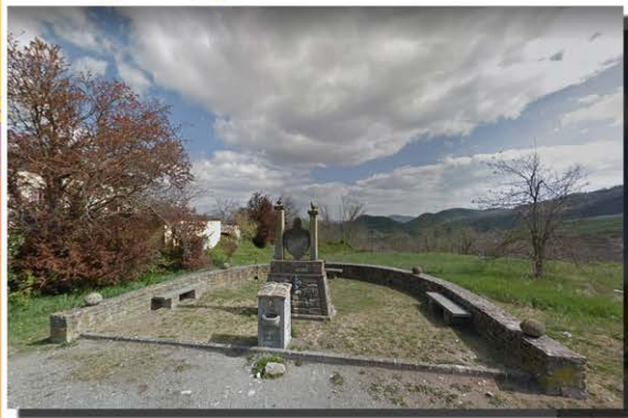
Monumento alla mamma - Ca' Bonaparte