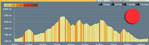
Altimetria Mediofondo Km. 95 disl. 1540m.