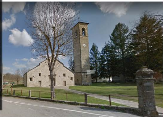
Pieve di Scurano