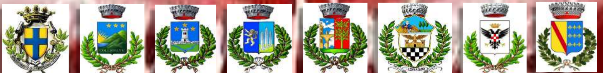
Parma Collecchio Neviano Arduini Lesignano Bagni Sorbolo Polesine Parm.se Zibello Sala Baganza

gli auguri di buon Natale e un sereno 2018