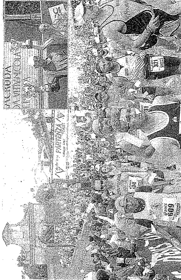
UNA MARCHESE COLORATA La spettacolare partenza da Barchi. Nella foto piccola, i due vincitori