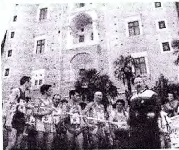
FASCINO Partenza di una precedente edizione di «Vivicittà» con i Torricini sotto l'occhio attento del cronometrista Oliveti

In precedenza, alle ore 9 partenza per la categoria Cadetti (5/7 anni di 150 metri); alle ore 9,20 categoria Cadetti (8/11 anni di 500 metri); alle ore 9,40 categoria Cadetti (12/14 anni di 1 km); alle ore