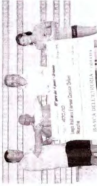
Il ricavato della manifestazione di Urbania è stato devoluto in favore della Lega italiana Fibrosi cistica