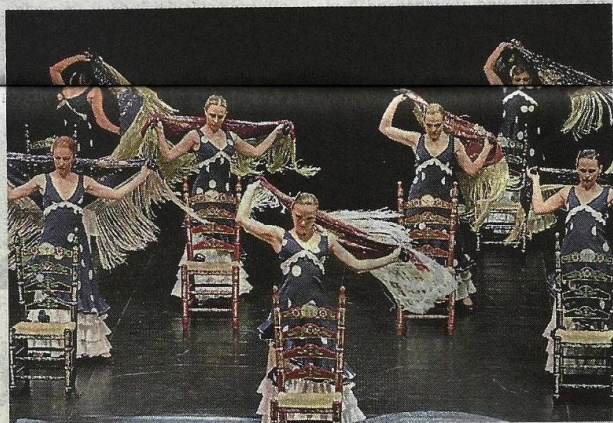
Torna «Pesaro città in danza» nelle foto alcune coreografie delle precedenti edizioni