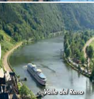
Valle del Reno