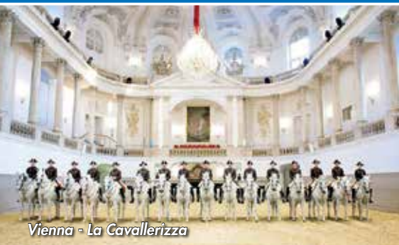
Vienna - La Cavallerizza