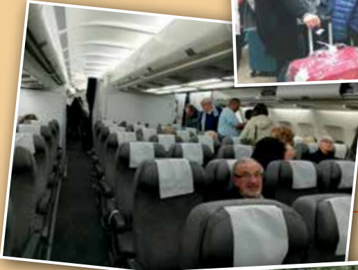
Un aereo solo per NOI