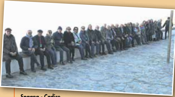
Spagna - Cadice Un attimo di relax Dicembre 2017