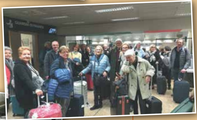
E si parte.... forse!!