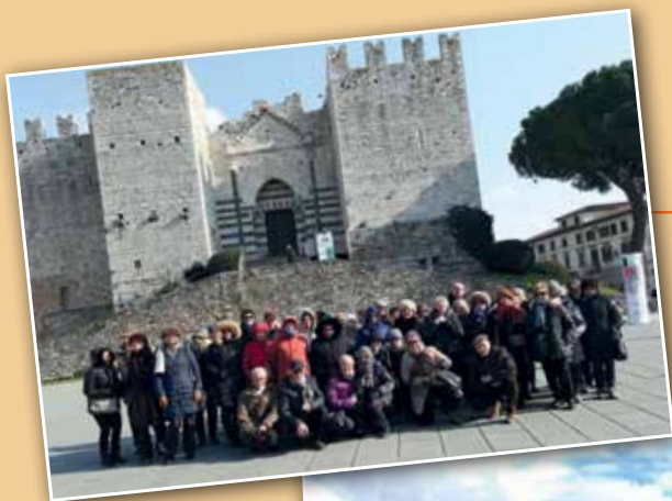
Pistoia-Prato 27 Febbraio 2018