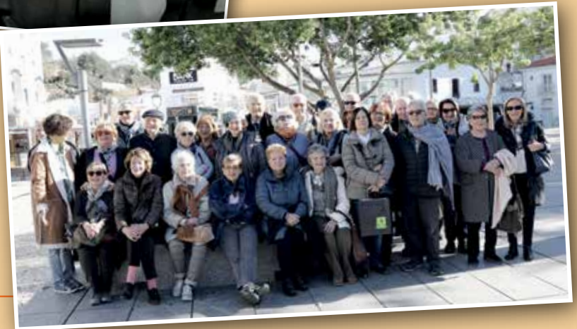
Portogallo Albufeira Dicembre 2017