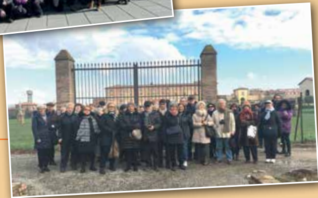
Sassuolo 13 Febbraio 2018