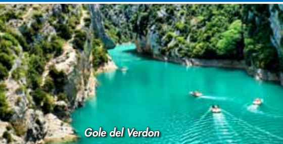
Gole del Verdon