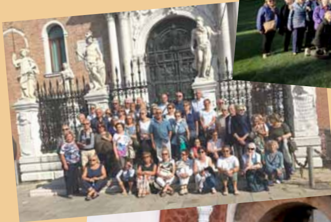
Venezia ingresso arsenale Settembre 2016