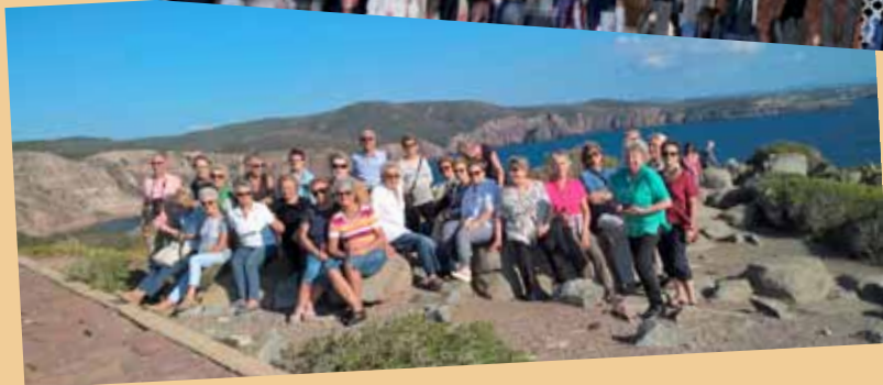
Sardegna Settembre 2016