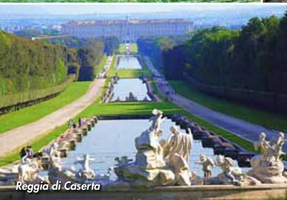
Reggia di Caserta