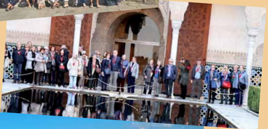
Granada Alambra Dicembre 2016