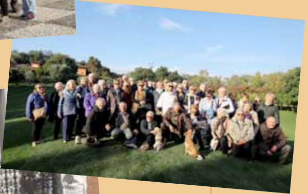
Montichiari pranzo sociale Ottobre 2016