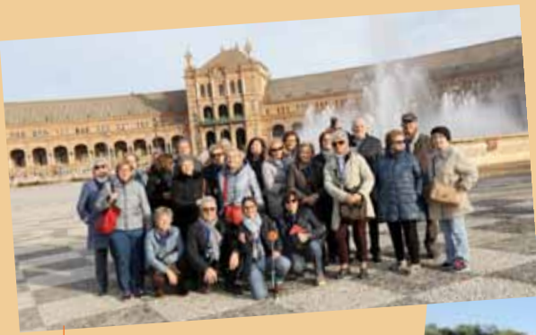
Siviglia Piazza di Spagna - Dicembre 2016