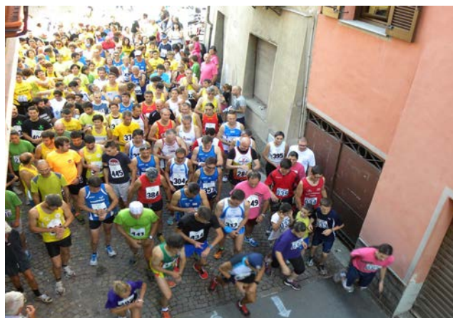
PARTENZA EDIZIONE 2015

Dopo la gara vi è la possibilità per i concorrenti e gli accompagnatori di PRANZARE presso il campo sportivo/area manifestazioni.