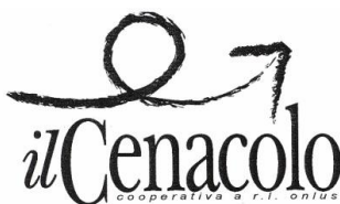
Coop. Sociale O.N.L.U.S. Consortziata CO&SO