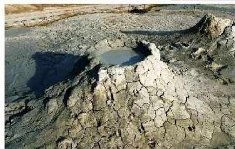
A soli 500 mt. dalla zona di ritrovo è possibile visitare la "Salsa" di Regnano