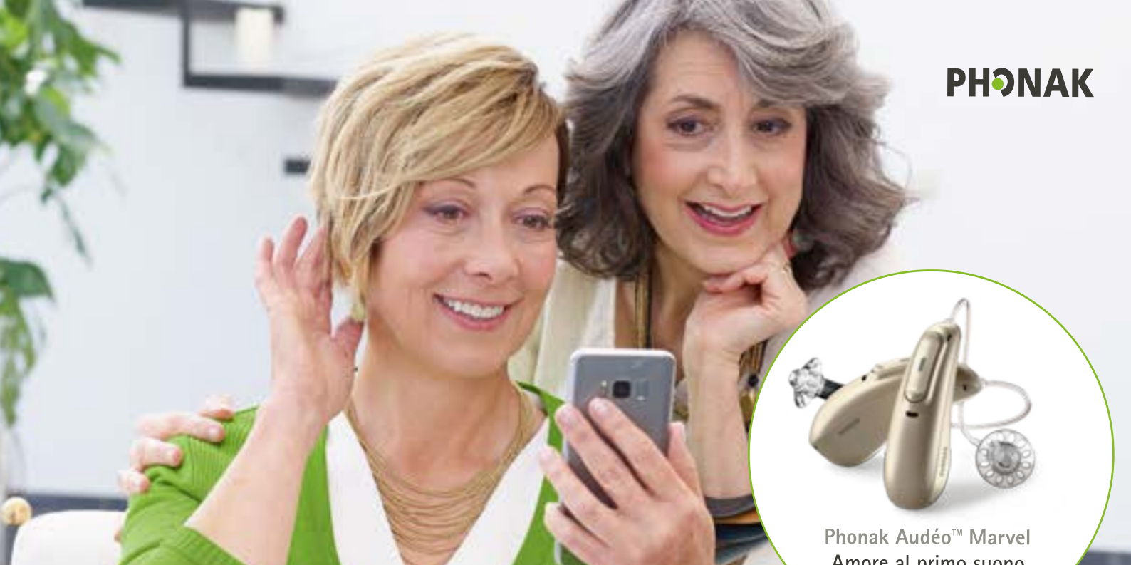
Phonak Audéo™ Marvel Amore al primo suono

CAI Centro Acustico Italiano di Reggio Emilia ha stretto una collaborazione con il comitato Territoriale Uisp RE garantendo a tutti i suoi associati servizi di alta qualità ad un prezzo scontato.