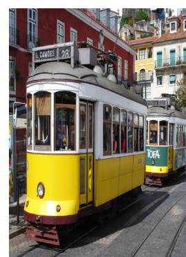
Lo storico tram su rotaia è il simbolo più bello di Lisbona