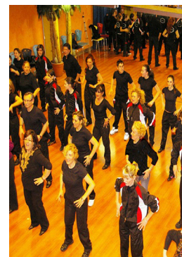
Un bella serata dei nostri balli di gruppo