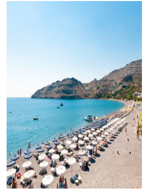
La spiaggia del villaggio di Rodi

Le iscrizioni vanno effettuate assolutamente entro la metà di Agosto, poiché i posti sono limitati; caparra € 100 a persona, saldo 25 giorni prima della partenza. Rimane escluso solo l'eventuale aumento carburante e delle tasse aeroportuali che non ha mai comportato differenze rilevanti e significative.