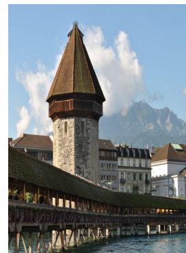
Lucerna: il famoso ponte di legno sul lago

Il costo è di € 185 a persona in camera doppia, € 205 in singola, comprensivo di viaggio in pullman, guida per una giornata emmezzo, una pensione completa, più un pranzo in ristorante tipico, assicurazione sanitaria e accompagnatore. Caparra € 100 a persona, saldo 15 giorni prima della partenza. In caso di rinuncia al viaggio a meno di 14 giorni, penale € 60.