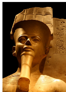
Interno del Museo Egizio