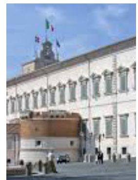
Palazzo del Quirinale