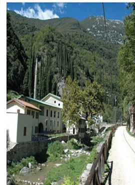
Il torrente Toscolano e il museo della carta

La quota Comprende: viaggio di A/R in aereo, bus da e per gli aeroporti, tre mezze pensioni con bevande, colazioni a buffet, due giorni emmezzo di visite con la guida in bus riservato, ingresso al Monastero de Jeronimos e Cattedrale, al Palazzo Reale di Sintra, assicurazione medica e assicurazione annullamento. Caparra € 100 a persona, saldo 20 giorni prima della partenza. Le penali sono quelle previste dell'assicurazione annullamento.