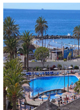
Le bellissime piscine dell'hotel Hesperia Troya direttamente sul mare e in centro al paese