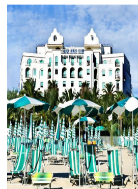
Il Grand Hotel Excelsior

Le escursioni saranno concordate sul posto in base alle richieste dei presenti.