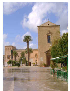
Piazza Scandaliato Sciacca

La quota comprende: viaggio di A/R in aereo, transfert da e per gli aeroporti, pensione completa con bevande, lettino ed ombrellone in spiaggia, l'assicurazione sanitaria, l'assicurazione annullamento, l'accompagnatore. Iscrizioni già aperte, caparra € 200 a persona, saldo entro il 22 agosto. Le penali in caso di rinuncia al viaggio, sono quelle previste dell'assicurazione annullamento, visionabile presso gli uffici UISP. Posti limitati prenotare subito.