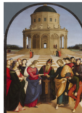
Lo sposalizio della Vergine

ATTENZIONE! Iscrizione od eventualmente segnalazione assolutamente entro Agosto; caparra € 150 a persona, saldo 25 giorni prima della partenza.