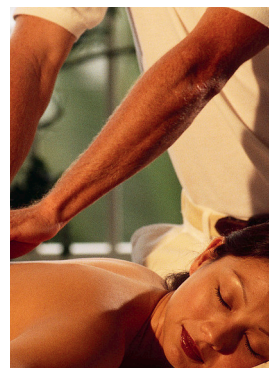
Relax a Montegrotto

Chi volesse andare in modo autonomo a visitare altre mostre o palazzi e non entrare al Museo Egizio il costo è di 30 Euro a persona. L'ingresso a Palazzo Reale costa € 12; alla Mole Antonelliana € 10. Non si effettuano rimborsi a meno di 8 giorni dalla partenza.