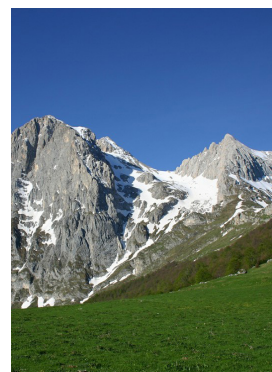
Il meraviglioso massiccio del Gran Sasso