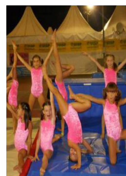
Con Giorgia una serata alla settimana balli di gruppo a "Festa Reggio"

VISSUTI CON UN GRUPPO FANTASTICO, OFFRONO ANCHE LA POSSIBILITA' DI CONTRARRE NUOVE AMICIZIE E CONOSCENZE.