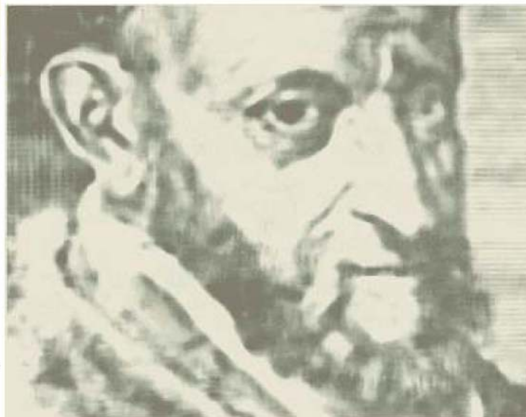
STAMPA, Sadeler Jean (Bruxelles 1550 - Venezia 1600) RITRATTO DI GIROLAMO MERCURIALE