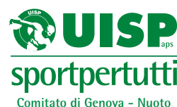
Questo è il marchio ufficiale Uisp, personalizzato a livello territoriale con il settore di attività di riferimento