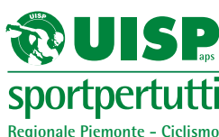
Questo è il marchio ufficiale Uisp, personalizzato a livello regionale con il settore di attività di riferimento