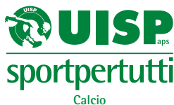
Questo è il marchio ufficiale Uisp, personalizzato a livello nazionale con il settore di attività di riferimento