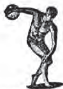
UNIONE ITALIANA SPORT POPOLARE