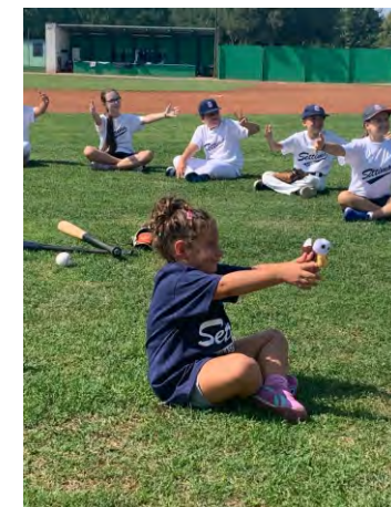
Stampa: Litografia CR - VAUDA C.SE (TO)