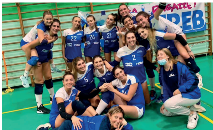
CHE VITTORIE Nixsa Allotreb e, sotto, Finimpianti Rivarolo Volley in festa

In serie C, primo successo nel girone A per la Canavese Volley Ivrea, vittoriosa 3-1 (23-25; 25-21; 25-16; 25-22) tra le mura amiche al cospetto del Volley Bellinzago. Nel girone B, vincono ancora la Finimpianti Rivarolo Volley, che passa al tiebreak (25-19; 12-25; 20-25; 25-15; 17-19) ad Alba con il Sole di Martino El Gall, e la Nixsa Allotreb, che conquista il derby di San Mauro Torinese ai danni de La Folgore Carrozzeria Meschia dopo 5 lunghissimi set (33-31; 17-25; 14-25; 25-22; 16-14). Stop interno per il Cargo Broker Savis: 1-3 (10-25; 26-24; 10-25; 20-25) con la Cascina Capello Chieri. Per il girone C, la Lilliput Pallavolo non lascia scampo alla Zs Ch Valenza imponendosi con un netto 3-0 (25-17; 25-15; 25-21), mentre la Pallavolo Montalto Dora va a conquistare l'intera posta in palio in casa della Venaria Real Volley: 1-3 (23-25; 15-25; 25-19; 24-26) il punteggio finale del confronto giocato a Borgaro Torinese. Tra i maschi, nel girone B di serie C, la Polisportiva Venaria cede al tiebreak (25-14; 25-20; 23-25; 22-25; 15-9) sul campo della Villanova/Vbc Mondovì, mentre resta ancora all'asciutto la PVL Cerealterra, battuta 1-3 (19-25; 9-25; 25-19; 19-25) dalla