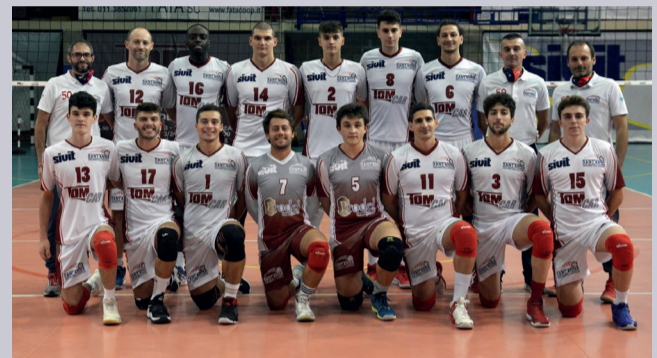
PROVA DI CARATTERE Il Sant'Anna TomCar vince in rimonta in Liguria

Viaggia a punteggio pieno nel girone A di serie B maschile l'Alto Canavese Volley che dopo il successo dell'esordio si ripete andando a vincere in 3 set (22-25; 20-25; 19-25) a Genova Bolzaneto contro la Consulting Global Colombo. Passo falso casalingo, invece, per la PVL Cerealterra Ciriè che si arrende per 0-3 (23-25; 20-25; 23-25) alla Novi Pallavolo, mentre il Sant'Anna TomCar ha fatto visita domenica 24 ottobre all'ADMO Volley Lavagna, tornando a casa dalla lunga trasferta ligure con una bella affermazione in rimonta al tiebreak (30-28; 25-17; 19-25; 16-25; 8-15). Spostando i riflettori sul settore femminile, da registrare nel girone A di B1 la battuta d'arresto esterna del Caselle Volley, sconfitto 3-0 (25-22; 25-23; 25-17) sul campo della Fo.Co.L Legnano. Dopo la vittoria inaugurale a Volpiano, la Savis Cargo Broker è stata di scena in Lombardia, in casa della Mondialclima Orago, mettendo in cassaforte un nuovo successo per 0-3 (14-25; 7-25; 16-25).